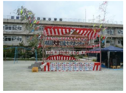
日進小校庭の夜の賑わい