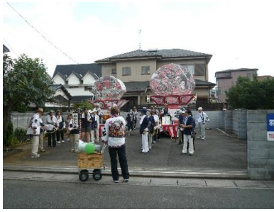
日進小校庭の昼の賑わい