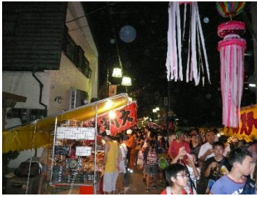
大野豊店から日進小方面