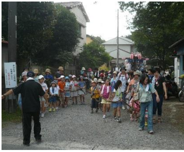
日進七夕通りの賑わい