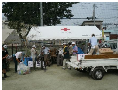
日進小校庭の清掃